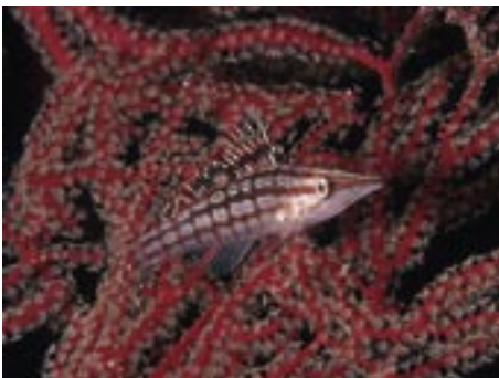
LANGNASEN BÜSCHELBARSCHE BEI NACHT

Im Makrobereich steht nur ein geringer Schärfentiefebereich zur Verfügung. Stellen Sie daher auf die bildwichtigen Motivbereiche scharf und achten Sie darauf, dass Sie die NahaEinstellgrenze Ihres Objektivs nicht unterschreiten. Zur Bildkontrolle empfiehlt sich bei digitalen Kompaktkameras der Monitor, da das Sucherbild meist nicht für den Makrobereich ausgelegt ist.