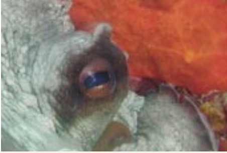
NAHAUFNAHME DES AUGES EINES OCTOPUSES